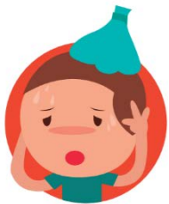
FIEBRE + 37°

Siempre avise a su enfermera escolar si el niño presenta alguno de estos síntomas: