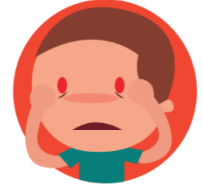
OJOS ROJOS CON PICOR O LEGAÑOSOS

Si alguno de estos síntomas se diese en horario escolar, se le avisará para que venga a recoger al niño y se le mantendrá, si fuese necesario, lo más aislado posible.