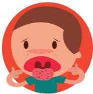
MANCHAS, GRANOS O ERUPCIONES