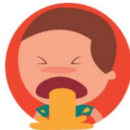
VÓMITOS O DIARREA