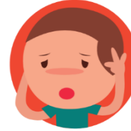
DOLOR DE CABEZA Y MAREOS